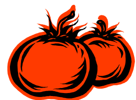
Pie de imagen o gráfico.

Publisher incluye miles de imágenes prediseñadas que puede importar a su boletín, además de herramientas para dibujar formas y símbolos. Una vez seleccionada la imagen, colóquela cerca del artículo. Asegúrese de que el pie de imagen está próximo a la misma.