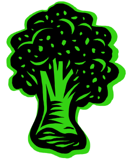
Pie de imagen o gráfico.

sitio Web. Microsoft Publisher ofrece una manera fácil de convertir el boletín en una publicación para el Web. Por tanto, cuando acabe de escribir el boletín, conviértalo en sitio Web y publíquelo.