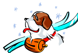
Pie de imagen o gráfico.

dibujar formas y símbolos. Una vez seleccionada la imagen, colóquela cerca del artículo. Asegúrese de que el pie de imagen está próximo a la misma.